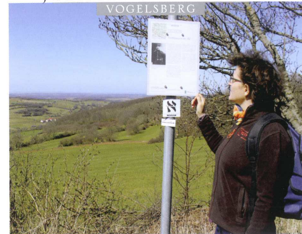
JUDENPFAD — EIN DEZENTRALES MUSEUM