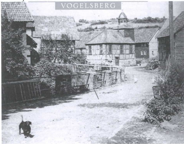
ALTE ORTSANSICHT VON KESTRICH